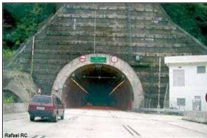
Figura 2 – Sinalização na entrada do túnel

5.9.2. Para os túneis acima de 1.000 m, devem ser instalados painéis internos eletrônicos a cada 500 m, indicando as condições de segurança no túnel.