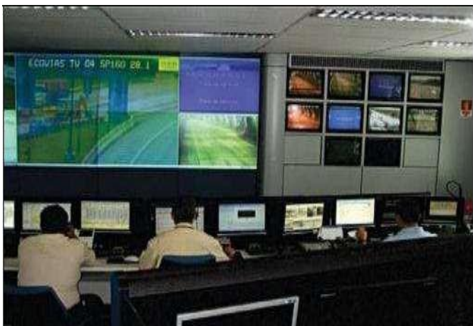
Figura 3 – Central de monitoramento

habilitada durante todo o período de funcionamento diário do túnel.