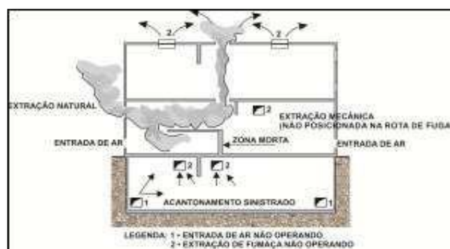
Figura 2 – Zonas mortas

b) Extração adequada da fumaça, não permitindo a criação de zonas mortas onde a fumaça possa vir a ficar acumulada, após o sistema entrar em funcionamento (ver Figura 2);