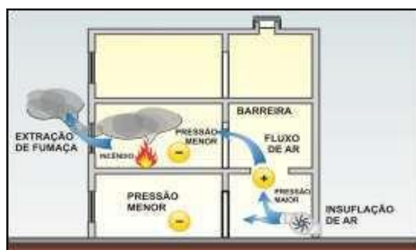
Figura 3 – Diferencial de Pressão

c) Permitir um diferencial de pressão, por meio do controle das aberturas de extração de fumaça da zona sinistrada, e fechamento das aberturas de extração de fumaça das demais áreas adjacentes à zona sinistrada, conduzindo a fumaça para as saídas externas ao edifício (ver Figura3).